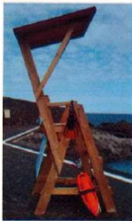
Sillas y torres de vigilancia